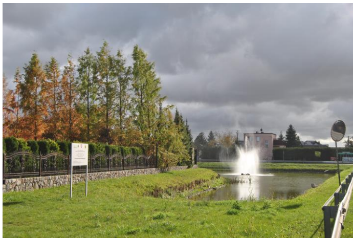
Staw z fontanną Pałędzie