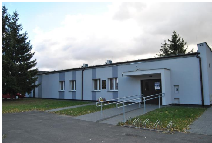
Świetlica wiejska Pałędzie