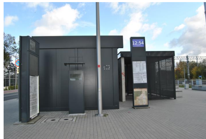
Parkuj i Jedź- przystanek przesiadkowy Pałędzie